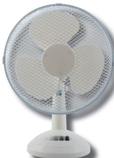
Tischventilator Table fan 613-546620