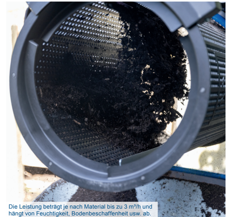
Die Leistung beträgt je nach Material bis zu 3 m³/h und hängt von Feuchtigkeit, Bodenbeschaffenheit usw. ab.