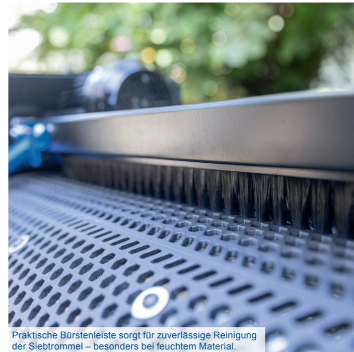
Praktische Bürstenleiste sorgt für zuverlässige Reinigung der Siebtrommel – besonders bei feuchtem Material.