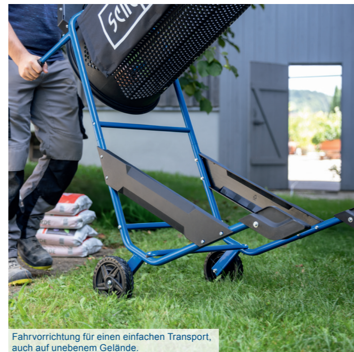
Fahrvorrichtung für einen einfachen Transport, auch auf unebenem Gelände.