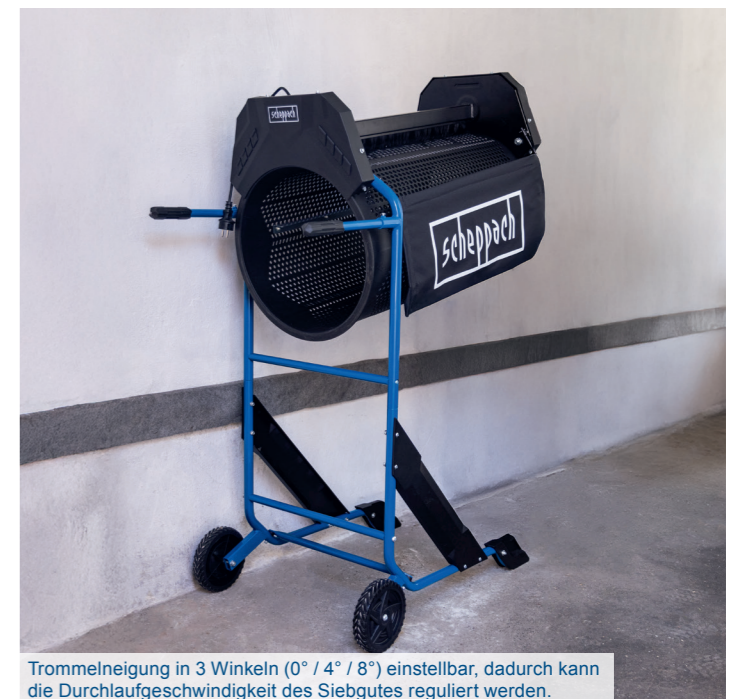
Trommelneigung in 3 Winkeln (0° / 4° / 8°) einstellbar, dadurch kann die Durchlaufgeschwindigkeit des Siebgutes reguliert werden.